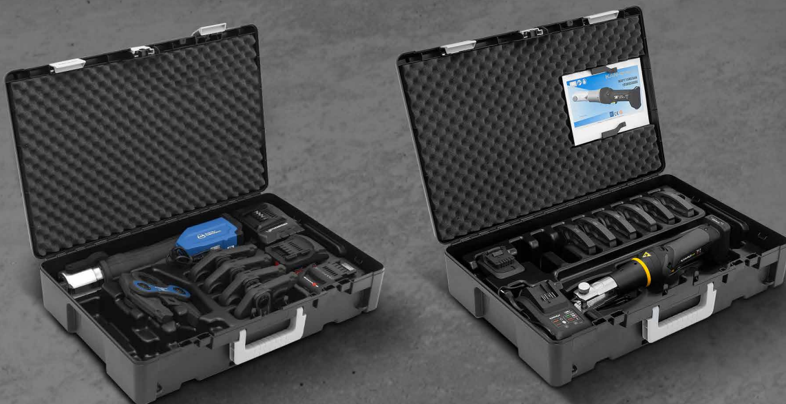
KAN-therm AC 3000

Имеются в наличии электрические сетевые или аккумуляторные инструменты известных компаний, в том числе новые персонализированные инструменты KAN-therm.